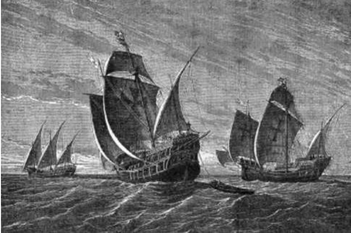
Η Santa Maria, η Pinta και η Niña