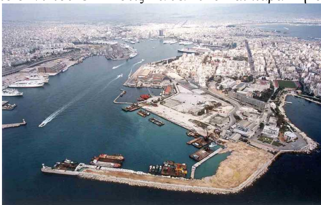
Εικόνα 6 ΟΠΛ

Στον έλεγχο της Cosco πέρασε το 51% του ΟΛΠ στις 10/08/2016 και παράλληλα έγινε και η καταβολή του τιμήματος των 280.500.000 ευρώ πράγμα που καθιστά τον Πειραιά ως ένα μεικτής διοίκησης λιμάνι. Οι Κινέζοι θα καταβάλουν άλλα 88 εκατ. ευρώ για την απόκτηση του υπολοίπου 16%, όταν ολοκληρώσουν τις επενδύσεις που προβλέπεται από τη