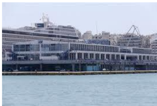
Εικόνα Τα γραφεία του ΟΛΠ.

Το Διοικητικό Συμβούλιο θα πρέπει να συνέρχεται με την απαραίτητη συχνότητα, ώστε να εκτελεί αποτελεσματικά τα καθήκοντά του. Η πληροφόρηση που του παρέχεται από τη Διοίκηση θα πρέπει να είναι έγκαιρη και έγκυρη, ώστε να του δίνεται η δυνατότητα να αντεπεξέρχεται