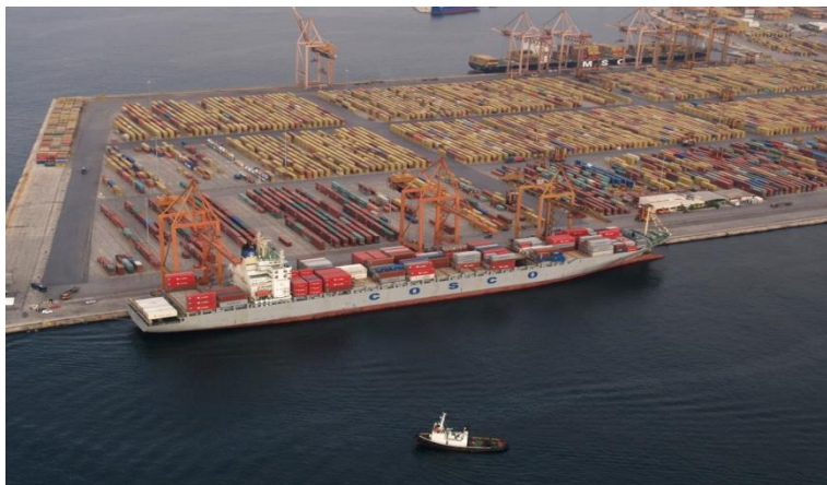
Εικόνα 71δωτικοποίηση ποσοστού του ΟΛΠ

Οι μελλοντικές επενδύσεις του Ομίλου έχουν ως στόχο τη μετατροπή του λιμένα του Πειραιά στο μεγαλύτερο διαμετακομιστικό λιμάνι εμπορευματοκιβωτίων στην Ευρώπη, καθιστώντας το στρατηγικό σημείο στην Ευρώπη καθώς και το μεγαλύτερο λιμάνι αναχώρησης στον κόσμο για εταιρείες κρουαζιέρας. Η COSCO SHIPPING θα επενδύσει σε αποβάθρα βεληνεκούς 300,000DWT καθώς και στην αναβάθμιση των γύρω υποδομών, με