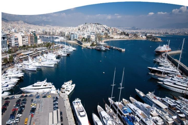
Εικόνα 2 Μαρίνα Ζέας : Ένας από τους πρώτους ιδιωτικούς λιμένες σε θέματα management

Οι ιδιωτικοί λιμένες είναι οι λιμένες οι οποίοι ανήκουν εξ ολοκλήρου σε ιδιωτικές εταιρίες και οργανισμούς. Η ύπαρξή τους δεν είναι τόσο συχνή καθώς τα περισσότερα εμπορικά λιμάνια διοικούνται μεν από ιδιωτικές εταιρίες χωρίς να έχουν την κυριότητα και τη δυνατότητα πώλησης του χώρου του λιμένα. Πιο συγκεκριμένα για τη διοίκηση