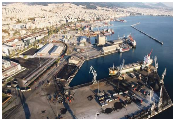
Εικόνα 3 Το λιμάνι του ΟΛΘ

Η ΟΛΘ ΑΕ, κυρίως με δικά της μέσα και προσωπικό, παρέχει υπηρεσίες ελλιμενισμού των πλοίων, διακίνησης όλων των ειδών των φορτίων και εξυπηρέτησης της επιβατικής κίνησης στο λιμάνι της Θεσσαλονίκης. Η εταιρεία αναλαμβάνει επίσης την κατασκευή νέων και τη βελτίωση και συντήρηση των υφισταμένων εγκαταστάσεων υποδομής του λιμένος, καθώς επίσης και την αγορά ή συντήρηση του απαραίτητου ηλεκτρομηχανολογικού εξοπλισμού.