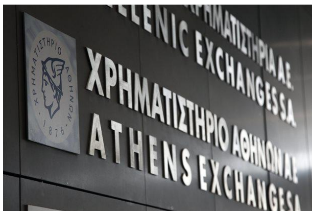
Εικόνα 8 Το χρηματιστήριο Αθηνών.