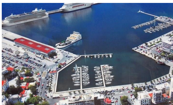
Εικόνα 4 Μορφοποιήσεις στο Κεντρικό Λιμάνι της Καβάλας.

15. Θεωρεί από κοινού με τον Πρόεδρο και τον Διευθυντή Διοικητικού, Οικονομικών και Προμηθειών της ετήσιες οικονομικές καταστάσεις της εταιρείας.