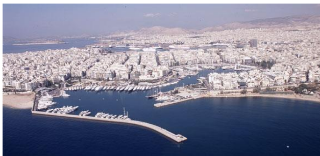
Εικόνα 5 Μαρίνα Ζέας

2.5.3 Η μαρίνα Ζέας είναι μια από τις πρώτες μαρίνες που εισέρχονται στον ιδιωτικό τομέα σε θέματα management με εμπλοκή του δημοσίου μόνο σε θέματα κυριότητας. Η πλήρης ιδιωτικοποίηση στον τομέα της διαχείρισης, επιφέρει ανάπτυξη των εγκαταστάσεων των