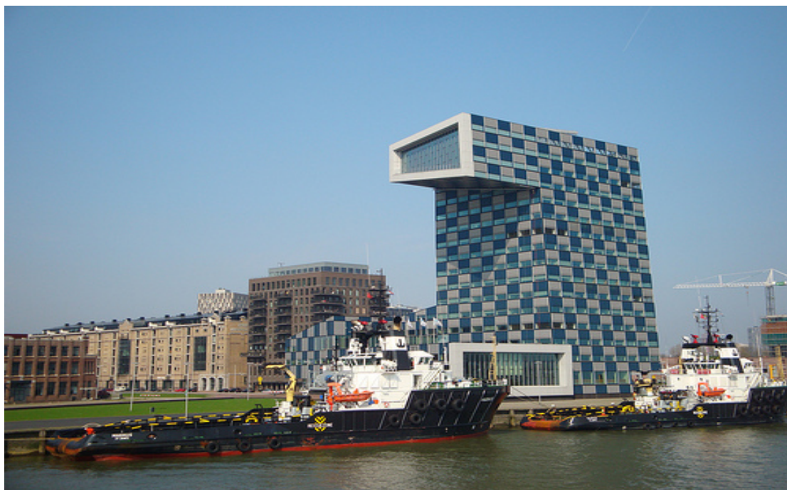
Netherlands Maritime University

Το Master of Science shipping and transports πρόγραμμα προσφέρει ένα τολμηρό πρόγραμμα με στόχο τη διεθνή συμμετοχή στα μαθήματα από ένα ευρύ φάσμα των εκπαιδευτικών προελεύσεων και επαγγελμάτων. Οι συμμετέχοντες στα μαθήματα , θα πρέπει να αποδειχθεί ότι είναι ταλαντούχοι και πρόθυμοι να δουλέψουν πολύ σκληρά και να δείξουνε τη φιλοδοξία ,να φτάσουν στην κλιμακωτή κορυφή ,στον κόσμο των επιχειρήσεων στη θάλασσα.