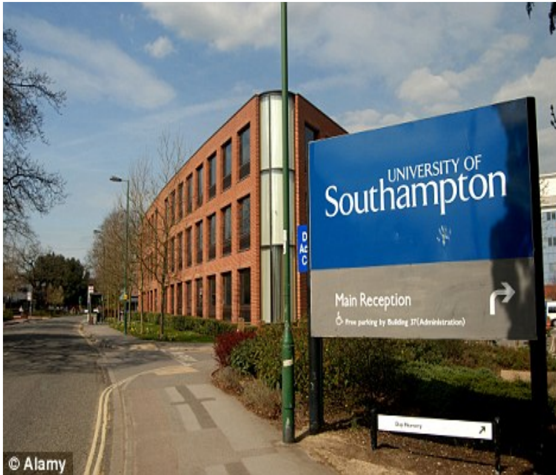
SOUTHAMPTON UNIVERSITY (Αγγλία)