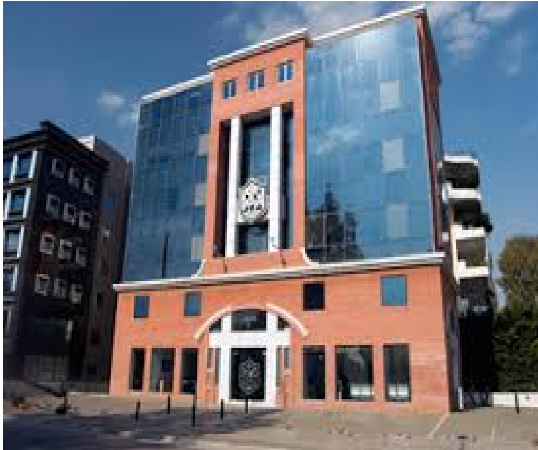
BCA COLLEGE(ΓΛΥΦΑΔΑ ΑΤΤΙΚΗΣ)