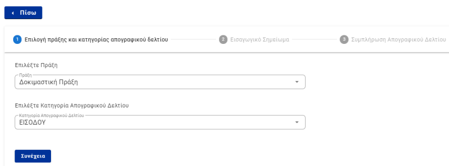
Εικόνα 3. Βήμα 1: Επιλογή Πράξης και Κατηγορίας Απογραφικού Δελτίου

Η διαδικασία αποθήκευσης ενός απογραφικού δελτίου αποτελείται από τρία βήματα. Στο πρώτο βήμα ο Σπουδαστής θα πρέπει να επιλέξει την Πράξη (Α' Θ.Ε.Τ. "ΠΡΑΚΤΙΚΗ ΑΣΚΗΣΗ ΣΠΟΥΔΑΣΤΩΝ ΑΚΑΔΗΜΙΩΝ ΕΜΠΟΡΙΚΟΥ ΝΑΥΤΙΚΟΥ (Α.Ε.Ν.) ΕΠΙ ΠΛΟΙΟΥ ΓΙΑ ΤΗΝ ΕΚΠΛΗΡΩΣΗ ΤΟΥ Α' ΘΑΛΑΣΣΙΟΥ ΕΚΠΑΙΔΕΥΤΙΚΟΥ ΤΑΞΙΔΙΟΥ ΤΟΥΣ") στην οποία θα αποθηκεύσει, καθώς και τον τύπο του δελτίου (εισόδου - εξόδου).