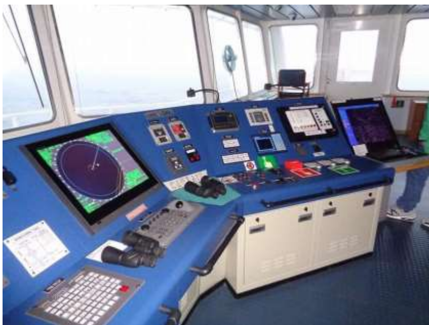
Γέφυρα M/V Desert Oasis

Το περιεχόμενο του Κ.Ε.Π. 1 που πρέπει να συμπληρώσει ο δόκιμος, είναι γραμμένο το μισό στην αγγλική γλώσσα ώστε να εξοικειωθεί με την αγγλική ναυτική ορολογία. Εδώ να επισημάνουμε ότι η ναυτική ορολογία και τα ναυτικά αγγλικά διαφέρουν κατά πολύ στο περιεχόμενο τους από τα συνήθη Αγγλικά, άρα ο δόκιμος πρέπει να γνωρίζει πολύ καλά την αγγλική γλώσσα.