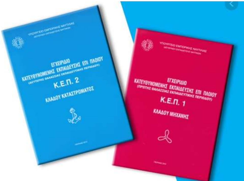
Εικόνα : Ίδρυμα Ευγενίδη, Κ.Ε.Π. 1 και 2

Παράλληλα με την συμπλήρωση του Κ.Ε.Π. , συμπληρώνει και το Ημερολόγιο Απασχόλησης σε καθημερινή βάση. Σε αυτό γράφεις καθημερινά τι κάνεις με βάση την εκπαίδευση στο πλοίο.