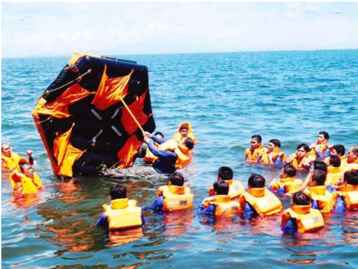
Τρόπος για να γυρίσει σωστά μια σωσίβια λέμβος

Επομένως στον βασικό κύκλο οι σπουδαστές εκπαιδεύονται σε θέματα που αφορούν την δική τους ασφάλεια αλλά και του πλοίου, την διάσωση τους σε περίπτωση ναυαγίου αλλά και σε θέματα πυρκαγιάς καθώς και σε περίπτωση χρήσης των πρώτων βοηθειών.