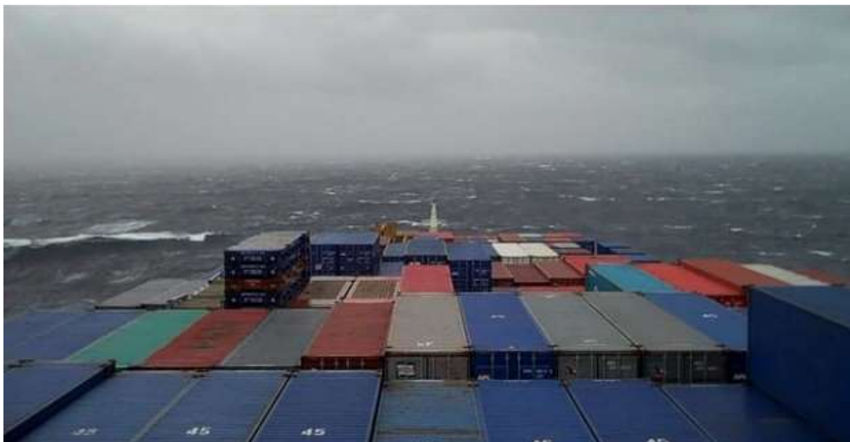
Κύριο κατάστρωμα Container-ship

Αρχική μεριμνά του εκπαιδευομένου είναι να βρει πάλι ναυτική εταιρεία ώστε να μπορέσει να ταξιδέψει. Ωστόσο, αν η αξιολόγηση του δόκιμου από την ναυτική εταιρεία που πραγματοποίησε το Α εκπαιδευτικό ταξίδι είναι καλή, υπάρχει μεγάλη πιθανότητα με την ίδια εταιρεία να ταξιδέψει ξανά. Στο Β' ταξίδι οι περισσότερες διαδικασίες και ενέργειες επαναλαμβάνονται όπως και στο Α' ταξίδι.