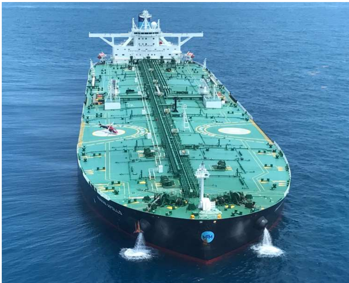
M/T Maran Apollo

Σ' αυτό το σημείο, συμπληρώνει το Κ.Ε.Π. 2 αλλά αυτήν τη φορά, το 70% του κειμένου είναι γραμμένο στην αγγλική γλώσσα.