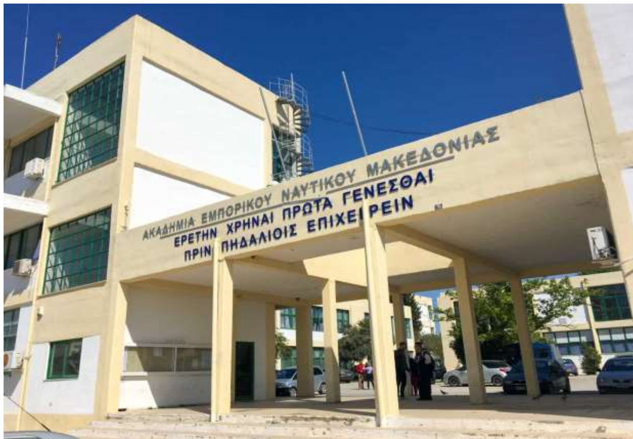
Γραμματεία Ακαδημίας Εμπορικού Ναυτικού Μακεδονίας