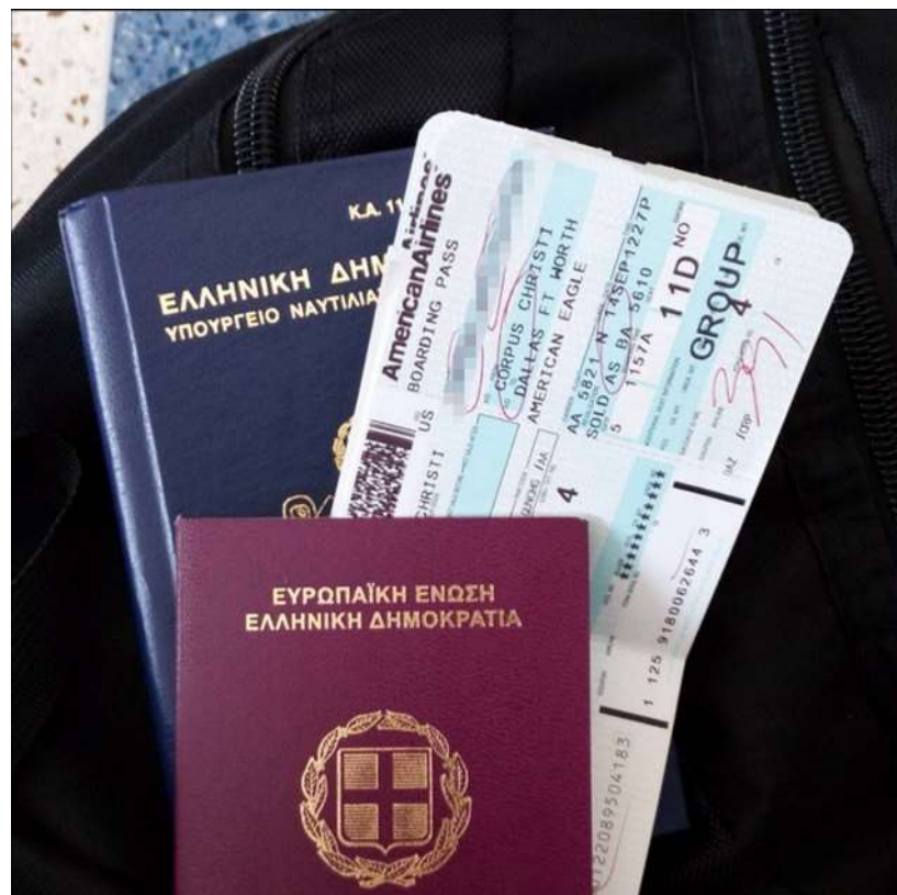
Διαβατήριο - Ναυτικό Φυλλάδιο – Εισιτήρια

Το καράβι είναι το δεύτερο σπίτι του ναυτικού και του δείχνει απολυτό σεβασμό. Ο Έλληνας ναυτικός ζει πάνω στη θάλασσα και πορεύεται πάνω σε αυτήν.