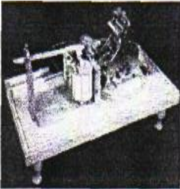
Τηλέγραφος Morse Ένας δέκτης τηλεγράφου Morse. Αυτός ο τύπος πρώτος

Η συσκευή του τηλετύπου συμπληρώνεται με ορισμένες ηλεκτρομηχανικές διατάξεις όπως είναι α)ο δίσκος επιλογής, β)το κουδούνι κλήσεως γ) ο διάτρητης ταινίας, δ)η διάταξη αναγνώσεως της διάτρητης ταινίας, κ.τ.λ