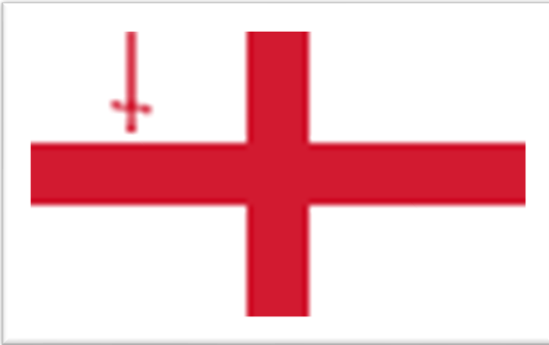
Εικόνα: Η σημαία του City of London, Πηγή: https://www.flags-and-anthems.com/city/flag-london.html )

Η σημαία της πόλης του Λονδίνου βασίζεται στη σημαία της Αγγλίας, έχοντας έναν κεντραρισμένο κόκκινο Σταυρό του Αγίου Γεωργίου σε λευκό φόντο, με το κόκκινο σπαθί στο επάνω καντόνι ανύψωσης (το επάνω αριστερό τέταρτο). Το ξίφος πιστεύεται ότι αντιπροσωπεύει το ξίφος που αποκεφάλισε τον Άγιο